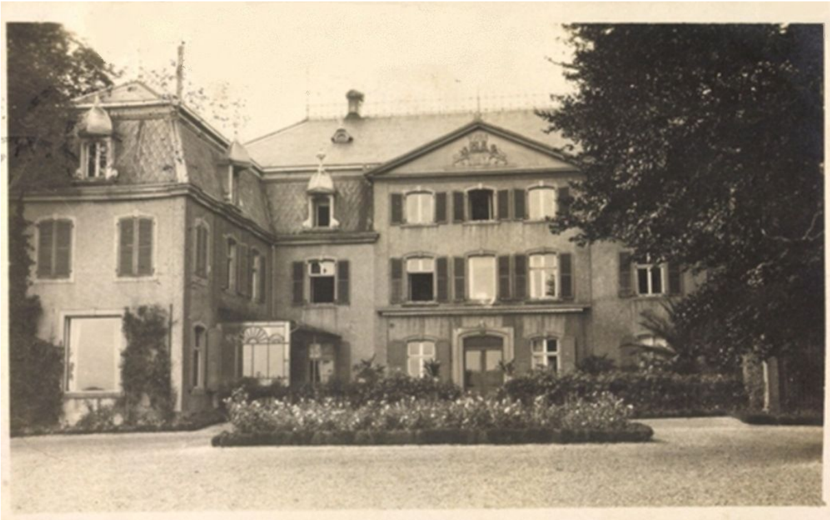
Schloss Stammheim 1924, auf der Übersichtskarte Nr.1