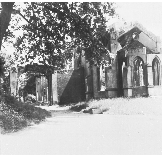
Bild der durch Bombeneinwirkung zerstörten Schloss-Kapelle, auf der Übersichtskarte Nr.4

Ein wohlgepflegter großer Park, mit seltenen alten Bäumen, schließt sich an.